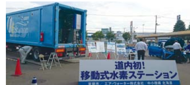
移動式水素ステーション(室蘭市)