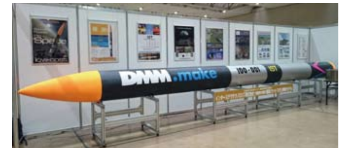
インターステラテクノロジズ(株)のロケット(大樹町)