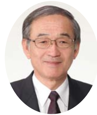
株式会社 北洋銀行 取締役頭取 石井 純二